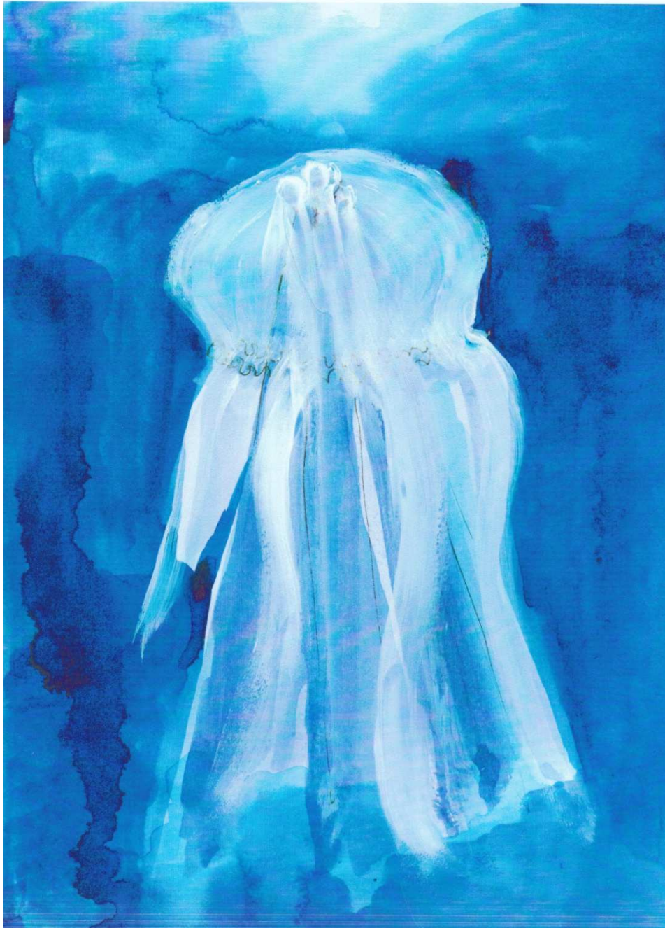
I. Fall 2 PAS, Bild 1